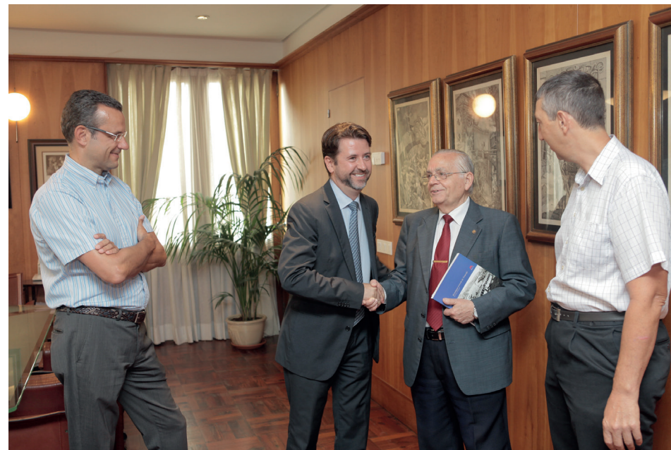
Entrega de la recaudación a Cáritas.