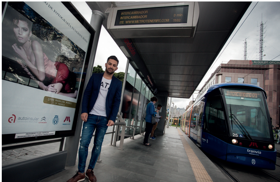
El certamen de fotografía registró 142 trabajos.

NUESTRAS PARADAS EXPONEN LAS MEJORES OBRAS DEL CONCURSO DE FOTOGRAFÍA TENERIFE MODA