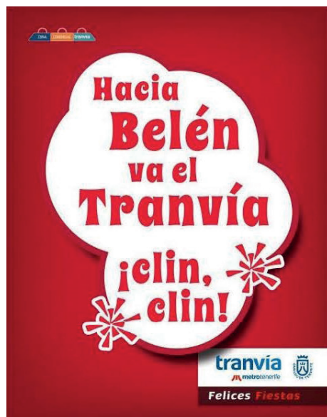
La campaña se completó con cartelería y rotulación de paradas, difusión en redes sociales y medios de comunicación.

La parada Intercambiador acogió la presentación de esta campaña que tuvo como objetivo promocionar el uso del tranvía, como alternativa eficaz al vehículo privado durante esas fechas navideñas, e impulsar, junto a Zona Comercial Tranvía, las compras en el comercio cercano de Santa Cruz y La Laguna.