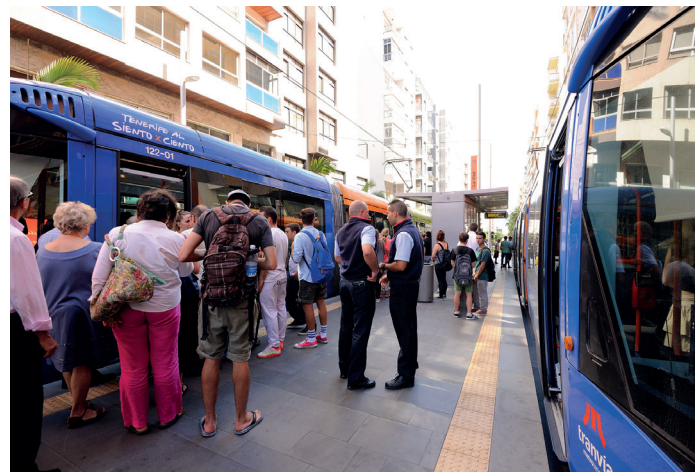
Pareja de revisores en la parada La Paz.

Los hechos se remontan al mes de marzo cuando nuestro compañero revisor le indicó que quitara sus pies del asiento a lo que el joven le respondió de manera violenta golpeándolo y tirándolo al suelo, hasta que pudo ser inmovilizado por los vigilantes de seguridad presentes en el tranvía.