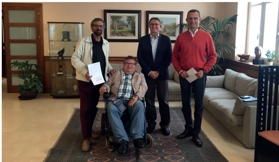
Colaboramos con la Coordinadora de Personas con Discapacidad Física de Canarias para desarrollar el proyecto 'Pardela'.

Con este servicio se facilitará a la población información sobre itinerarios adaptados desde las paradas del tranvía a zonas comerciales y otros lugares de interés, asesoramiento para la adaptación de espacios e información sobre normativa en materia de accesibilidad.