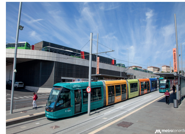
El servicio tiene una fiabilidad cercana al 100 %.

El servicio, integrado por las dos líneas que operamos actualmente, ha realizado hasta la fecha más de un millón de viajes comerciales (1.082.695) y sus vehículos han recorrido un total de 10.646.667 kilómetros.