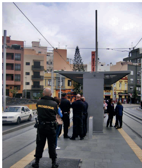
La Ley 16/1987 reconoce a los revisores o agentes de fiscalización del metro ligero la consideración de agentes de la autoridad.

El autor de los hechos fue condenado a cuatro meses de prisión como autor criminalmente responsable de un delito de atentado a la autoridad penado en los artículos 550.1 y 2 del Código Penal. Para Metrotenerife es la primera sentencia de este tipo tras la aplicación de la Ley Orgánica 1/2015 de 30 de marzo.