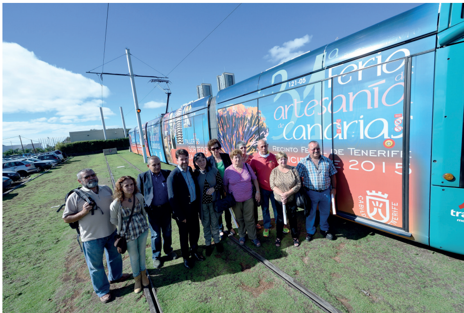
La 31ª edición de la Feria de Artesanía de Canarias contó con la participación de más de 140 artesanos.