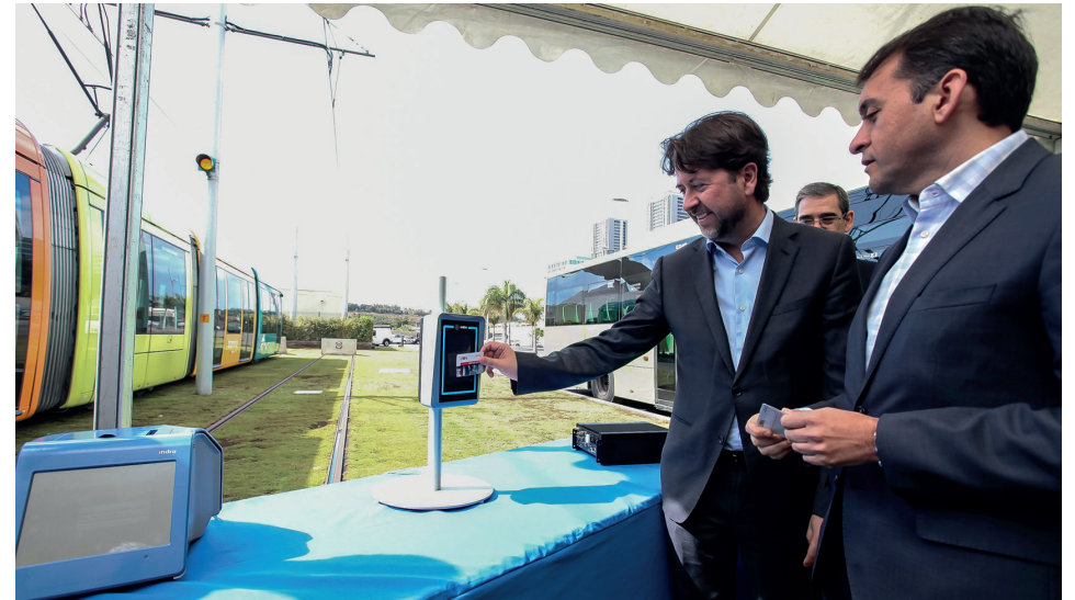
Acto de presentación del billete sin contacto que se instalará en nuestro tranvía.

Un total de 142 trabajos concursaron en este certamen de fotografía 'Moda y Mar'. Las mejores fotografías se expusieron en las paradas de las dos líneas de nuestro tranvía.