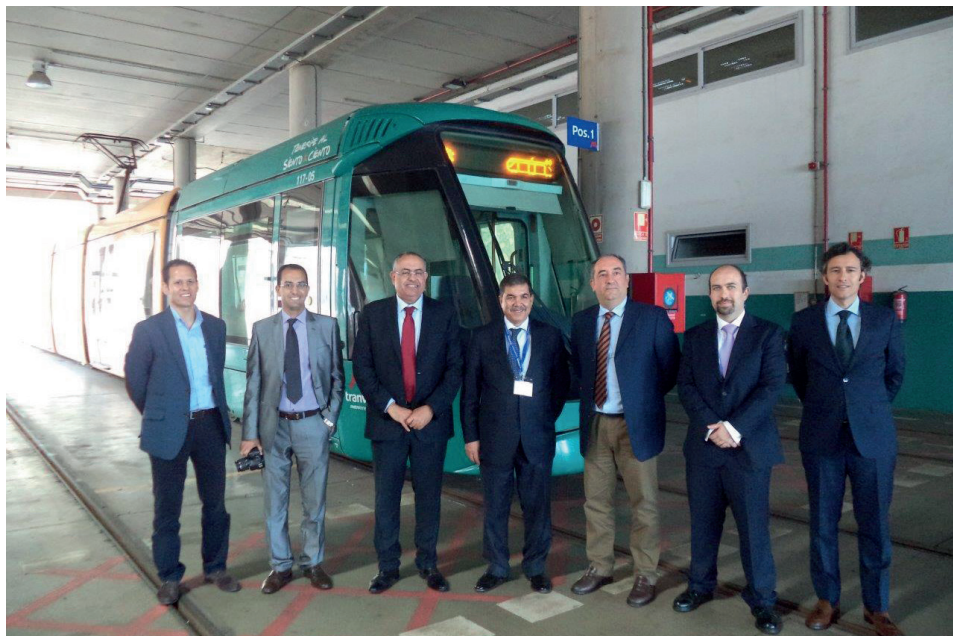
La delegación marroquí se interesó por el mantenimiento de nuestros tranvías.