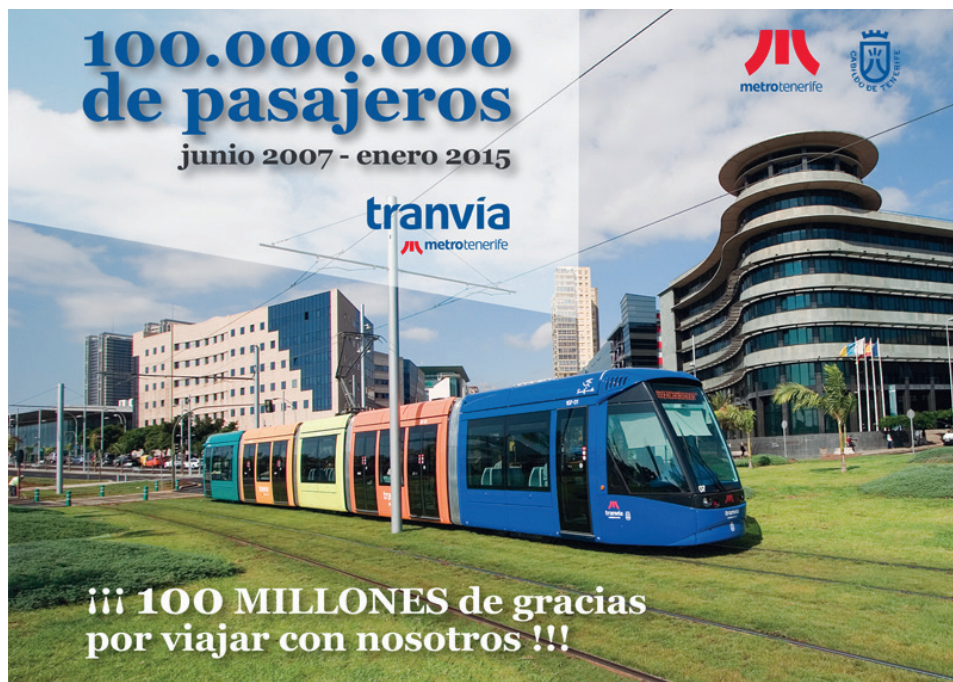
Campaña publicitaria para celebrar los 100.000 millones de pasajeros.

Nuestra red tranviaria tiene dos líneas en servicio con un recorrido total de 15 kilómetros y 25 paradas. Contamos con una flota de 26 tranvías, los cuales han recorrido una media anual de 450.000 kilómetros cada uno.