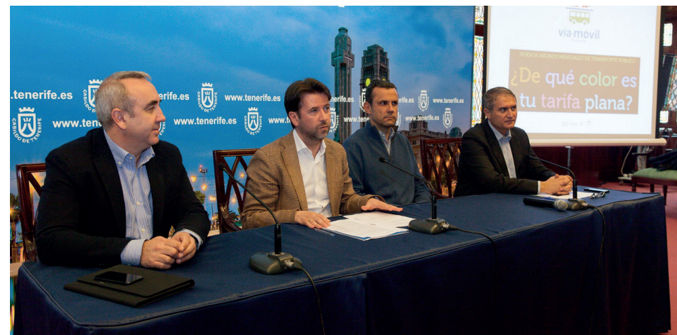
Rueda de prensa para la presentación de Vía-Móvil Insular.