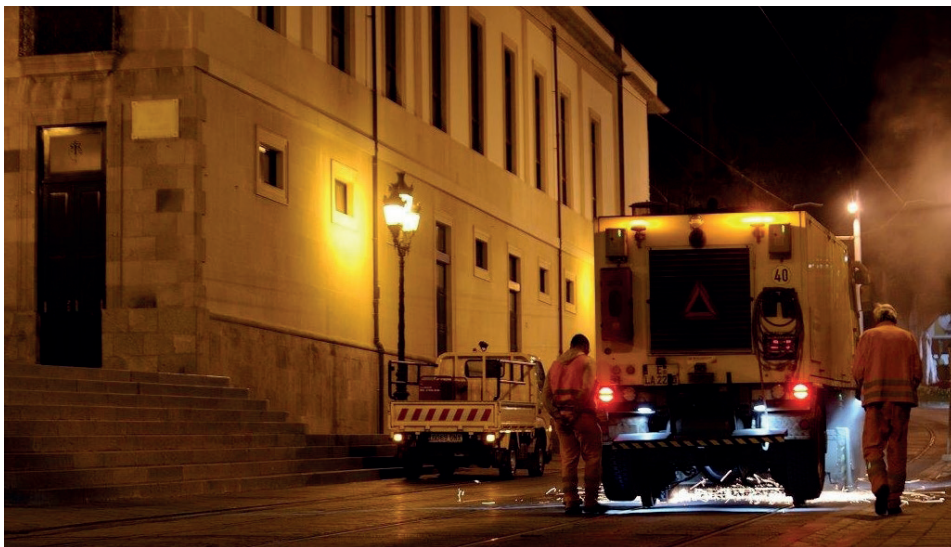
Trabajos de amolado de los carriles frente al Teatro Guimerá.

Con personal y maquinaria especializada, los trabajos consistieron en retirar las pequeñas imperfecciones que se formaron en el carril por el contacto de las ruedas de los tranvías. Dichas imperfecciones se eliminaron mediante discos abrasivos movidos a altas revoluciones por un 'tren de amolado', devolviéndole al carril su perfil original.