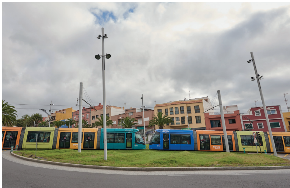
Los tranvías-dobles operan en jornadas de extraordinaria demanda.

Ofrecimos más de 100.000 plazas y transportamos 48.000 pasajeros. Esta jornada supuso un incremento del 27,56 % (más de 10.000 viajeros) en relación al pasado año, y de un 132 % respecto a una jornada habitual de fin de semana, cuya media se sitúa en unos 20.000 usuarios.