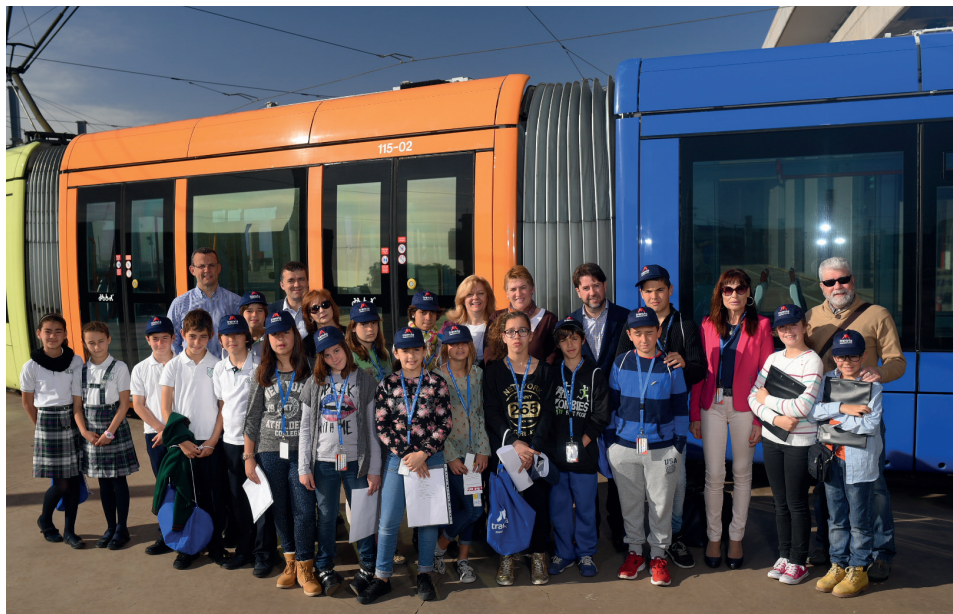
Autoridades y alumnos en la presentación de la nueva edición de 'Leemos en el tranvía'.