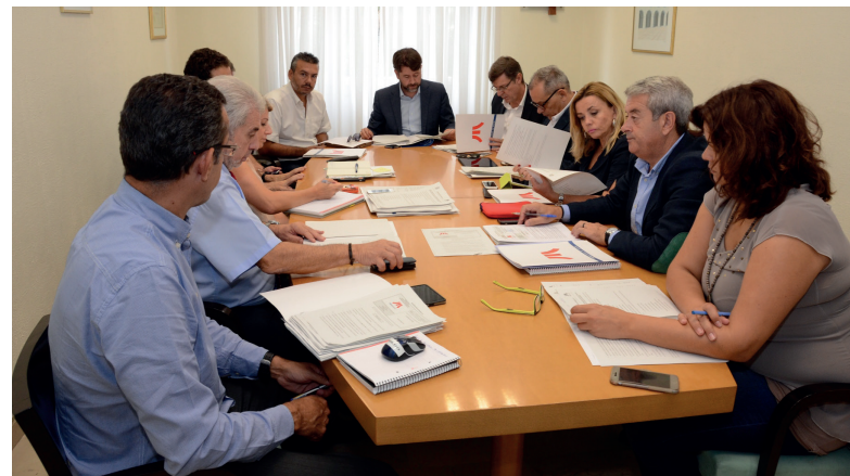
Sesión del Consejo de Administración en la que se llevó a cabo la renovación de nombramientos.