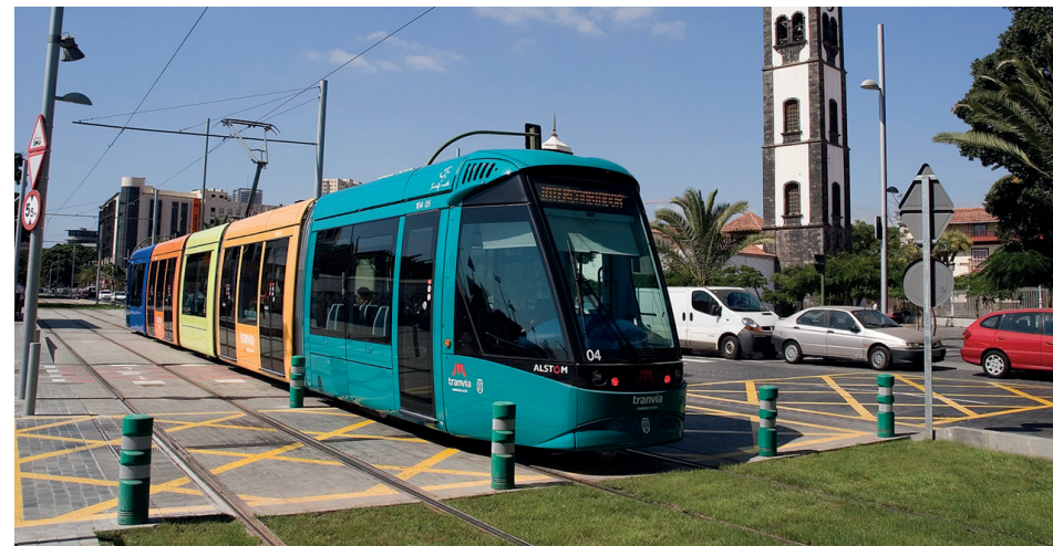
Tranvía en la parada Fundación.