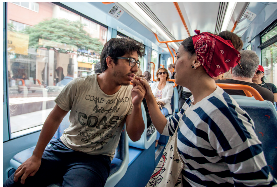
Los jóvenes cantantes interpretaron fragmentos operísticos durante los viajes del tranvía.

También acordó con carácter inmediato la contratación de 4 conductores y 3 agentes de fiscalización de esta bolsa para su incorporación a la plantilla. El resto de los integrantes estarán supeditados a nuevas necesidades del servicio, con una vigencia de 18 meses definida en las bases de la convocatoria.