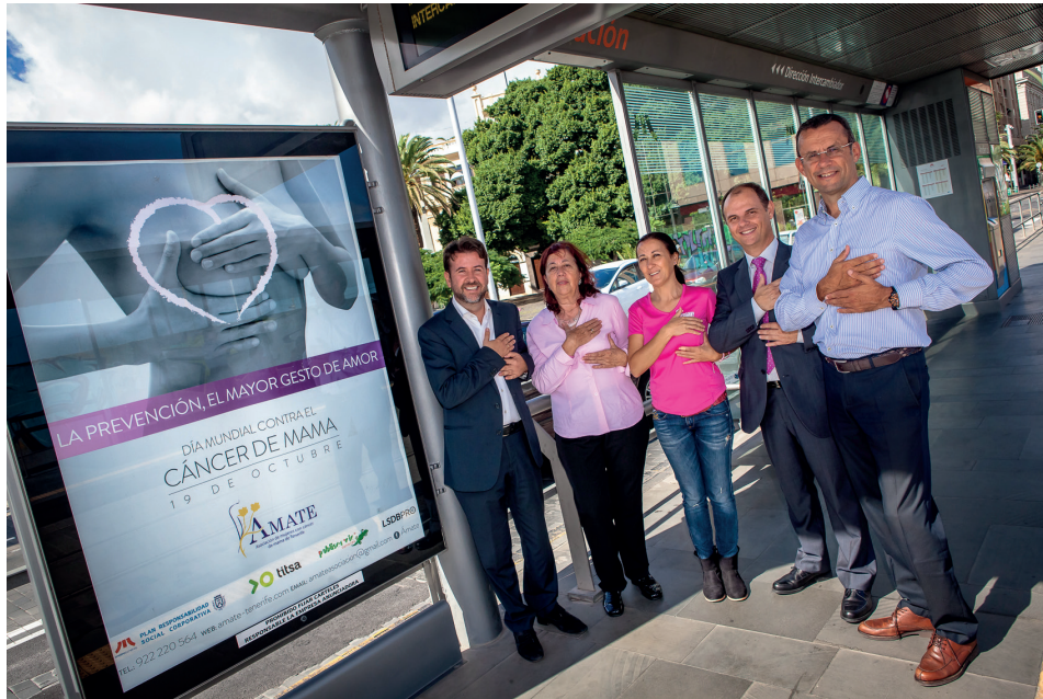
Presentación de la campaña en la parada Fundación.