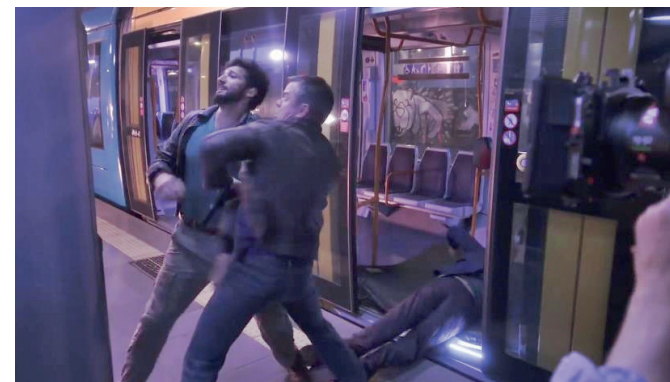
Fotograma extraído del vídeo Jason Bourne - Featurette: "Jason Bourne is Back".

• Universal Pictures eligió nuestro tranvía y varias localizaciones de nuestras líneas para la grabación de la nueva entrega de la saga Jason Bourne. Por este motivo tuvimos que adaptar nuestro servicio de la Línea 1