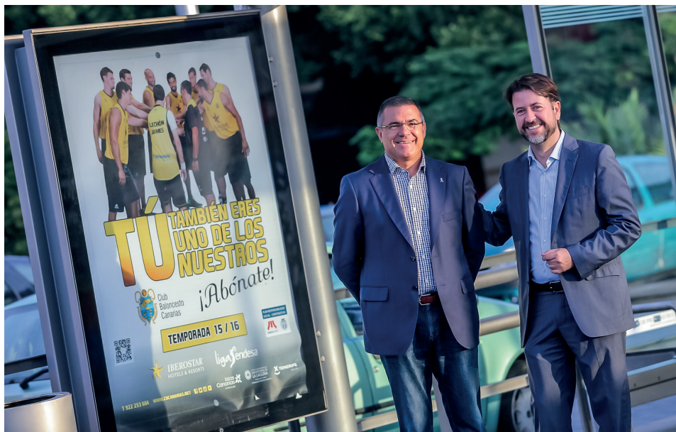
Presentación del acuerdo de colaboración en la parada Fundación.

Nuestro presidente y del Cabildo Insular de Tenerife, Carlos Alonso, y su homólogo en el Iberostar Tenerife, Félix Hernández, refrendaron este convenio en la parada Fundación con la imagen oficial de la citada campaña, la cual también estuvo presente en otras 16 paradas de la Línea 1, entre otras acciones promocionales.