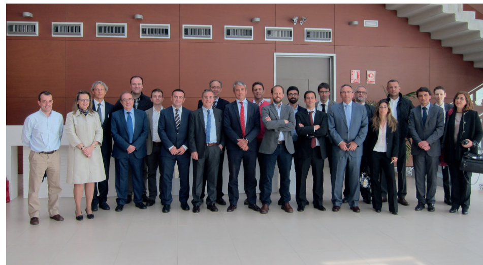
Nuestro gerente informó en este encuentro sobre las novedades implementadas en el tranvía de Tenerife.