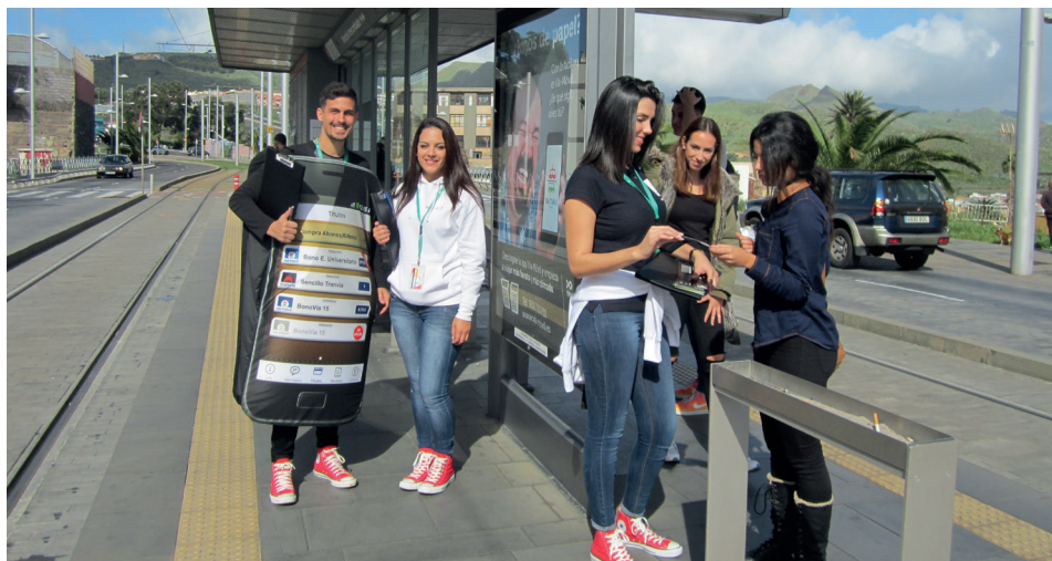
El 25 % de nuestros clientes utilizaron Vía-Móvil en sus viajes.

Azafatas y dinamizadores estuvieron en distintas paradas con el objetivo de dar a conocer los beneficios de este sistema que, desde hace meses, está operativo en toda la red insular de transporte público.