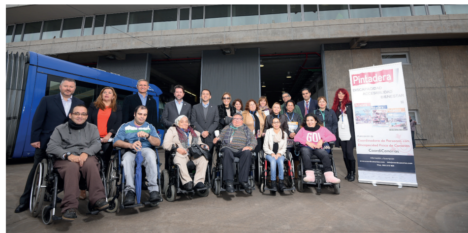
Autoridades y miembros de la Coordinadora de Personas con Discapacidad Física de Canarias celebran el 35º aniversario de esta asociación.