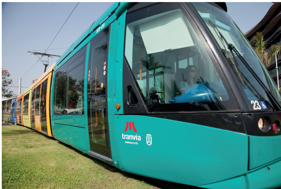
En 2015 nuestra plantilla estuvo integrada por 182 profesionales.